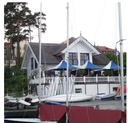
Den Scharmützelsee vor der Haustür