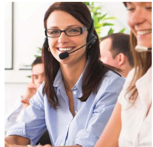
Lernen in modernen Trainingszentren