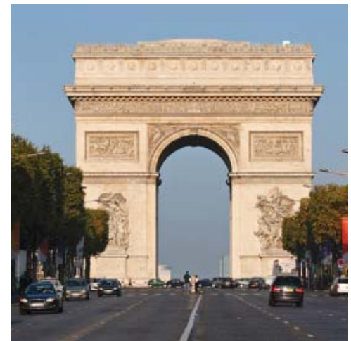
Die Welt bereisen und verstehen